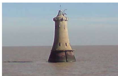
Piedra Diamante 8

En este lugar comienza un tramo de menor profundidad, y su dirección es aproximadamente paralela a la costa uruguaya, encontrándose un subsuelo rocoso, proveniente de la falla geológica que por momentos aflora, en medio del río y está señalada con una baliza en forma de pequeño faro.