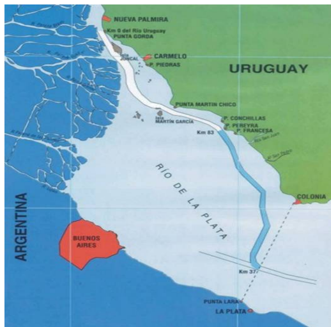
Canal Martín García 6

Argentina accede a dar conformidad a Uruguay en el dragado, obra a realizar en forma conjunta, aunque lo condiciona, y Uruguay deja de lado todo lo referente a integrar el Plata a la Hidrovía, como se había solicitado por parte de los otros miembros firmantes del sistema.