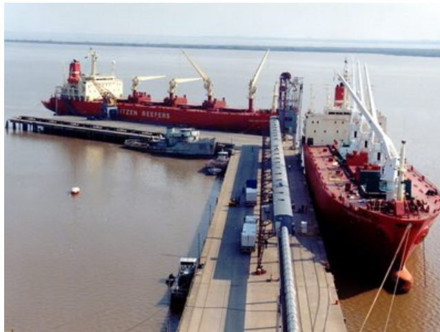
Puerto de Fray Bentos 2

El primero, viniendo de norte a sur, es de la Colonia San Javier, sobre la desembocadura del arroyo Farrapos, a la fecha sin actividad, y parcialmente anegado.