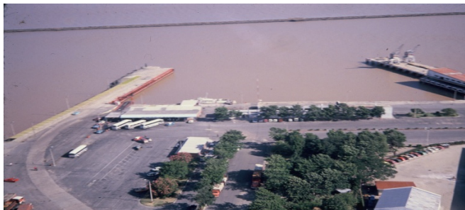
Puerto Colonia 10

Sólo se emplea para el tráfico de pasajeros y ocasionalmente tenía actividad de buques fluviales de petróleo para abastecimiento de la planta industrial textil, hoy sin actividad.