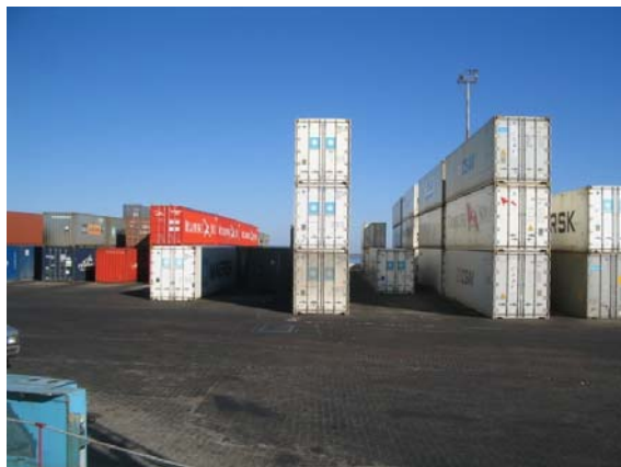
Playa contenedores Puerto de Montevideo 11

Las facilidades portuarias entre ambos países, integra el cuerpo del Tratado de 1973, en su Capítulo IV “Facilidades portuarias, alijos y complementos de carga”, donde se fija el compromiso de realizar estudios y adoptar las medidas necesarias para dar la mayor eficacia posible a sus servicios portuarios, de modo de brindar las mejores condiciones de rendimiento y seguridad y ampliar las facilidades que mutuamente se otorgan en sus respectivos puertos.