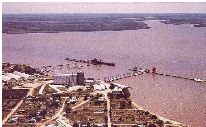
Puerto de Nueva Palmira 5

Es necesario recurrir a lo dispuesto en el Tratado del Río de la Plata del 19 de noviembre de 1973, para comprender los factores políticos jurídicos que deben tenerse en cuenta, en las diferentes etapas del manejo de obras sobre el tramo del Canal, ahora llamado Martín García, cuyas características son esenciales para la actividad portuaria de Nueva Palmira.