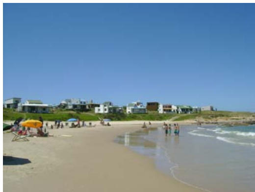
Cabo Polonio 12

Las características de un puerto ubicado en un lugar de la costa, sobre aguas oceánicas de profundidades naturales que admiten los mayores buques con grandes capacidades de transporte de cargas.