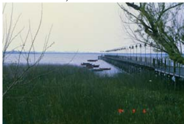
Muelle Villa Santo Domingo de Soriano 3

A la altura del kilómetro 61 del Río Uruguay, desemboca el Río Negro que permite la navegación de embarcaciones menores, hasta la Ciudad de Mercedes.