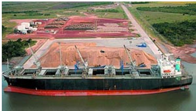
Construcción puerto Conchillas 7

A mitad aproximadamente de este recorrido, se proyecta construir una terminal portuaria para empresa de forestación, que se instalará en proximidades de la localidad de Conchillas, sobre la punta denominada “Pereyra”.