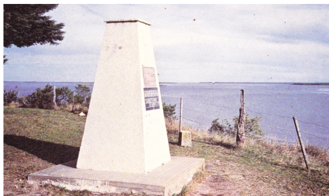
Mojón Paralelo Punta Gorda, fin Río Uruguay, nace Río de la Plata 4

A pocos kilómetros, aguas arriba de la desembocadura del Río Uruguay en el Plata, se encuentra el Puerto de Nueva Palmira, ubicado además, frente a la boca del Delta del Paraná, conocida por Paraná Bravo, la salida tradicional de los buques de mayor calado y porte que remontan el Paraná.